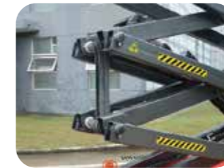
Barre de sécurité pour l'entretien

En cas de panne de courant, ce système ramène l'opérateur au sol en toute sécurité.