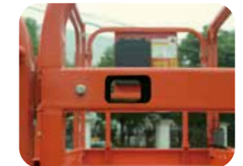
Porte de plateforme autobloquante

Elle permet de soutenir l'opérateur pendant l'entretien et d'assurer sa sécurité.