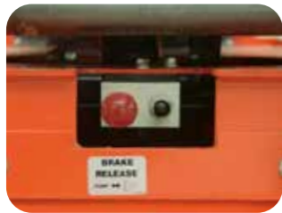
Soupape de décharge manuelle (conduite hydraulique)

La soupape de décharge manuelle permet de déplacer la série SC en cas de panne de courant.