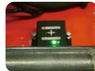
Protection contre l'inclinaison

Le système de freinage automatique élimine les risques de glissement pendant les travaux en pente.