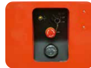
Bouton d'arrêt d'urgence

Pour plus de sécurité, ce voyant reste allumé pendant l'utilisation de l'appareil.