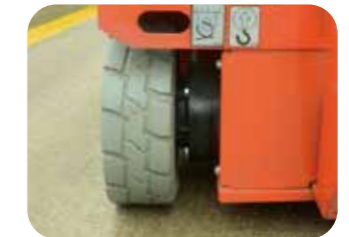
Système de freinage automatique

Lorsque le véhicule est en position de levage, le panneau de protection contre les trous au sol s'ouvre automatiquement.