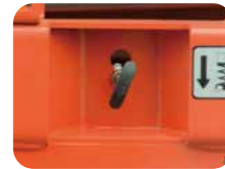
Système d'abaissement d'urgence

En cas de panne de courant, ce système ramène l'opérateur au sol en toute sécurité.