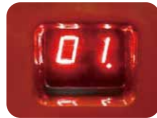
Affichage du code d'erreur

Enregistre automatiquement le temps de fonctionnement. L'utilisateur peut effectuer l'entretien périodique aux intervalles appropriés.