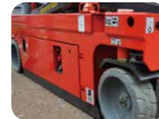
Système de protection contre les nids-de-poule

Les systèmes de levée et descente sont tous deux équipés d'un bouton d'arrêt d'urgence. En cas d'urgence, toutes les actions sont interrompues après avoir appuyé sur le bouton, ce qui garantit la sécurité de l'opérateur.