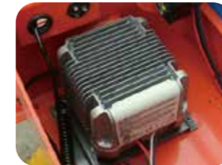
Système de protection de la charge

Lorsque la nacelle de la série SC est stockée, le fait d'appuyer sur ce bouton coupe l'alimentation, évitant ainsi la décharge de la batterie.