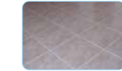
Petites briques type tomette