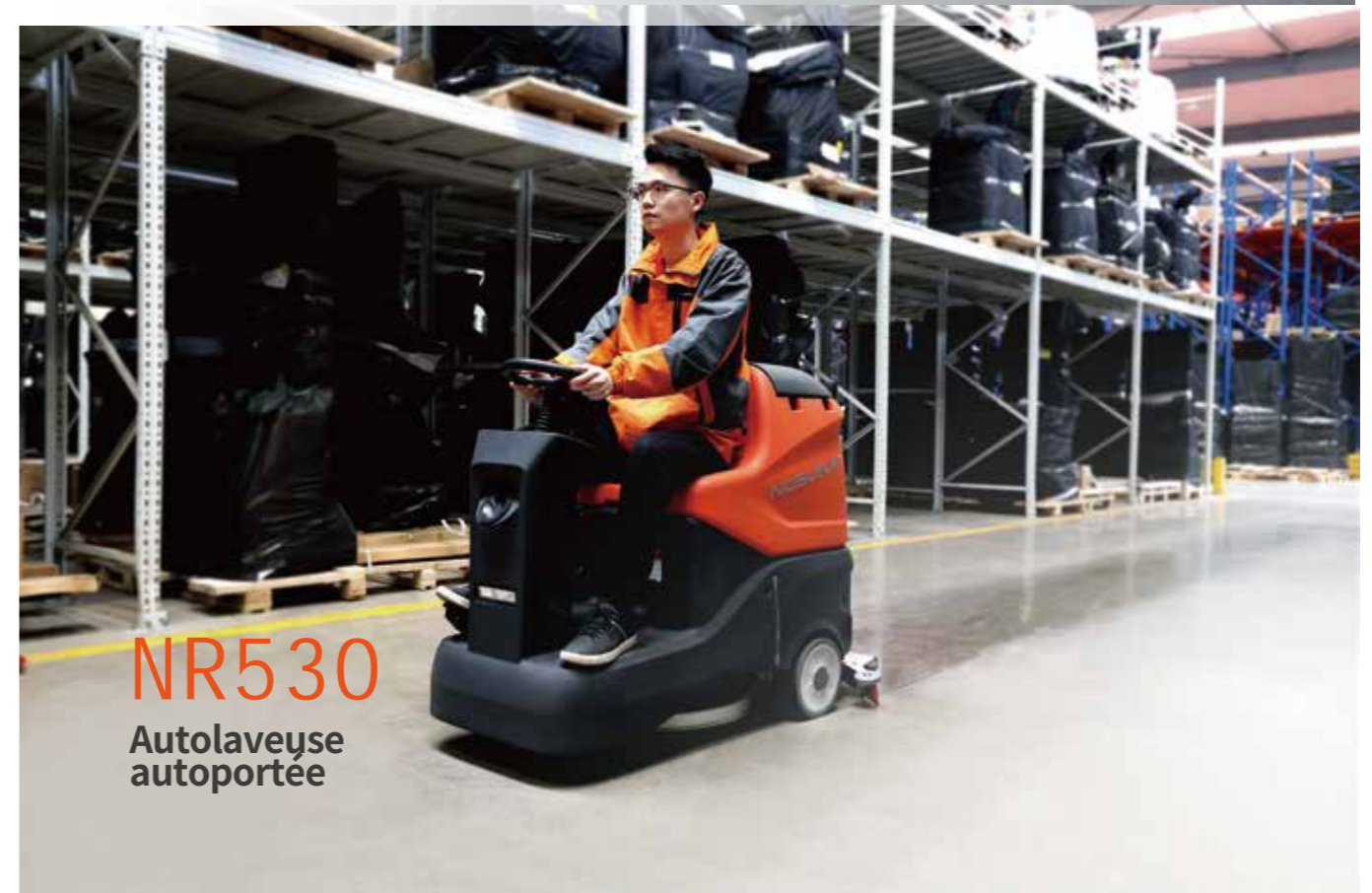
NR530 Autolaveuse autoportée