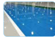
Résistant à l'usure