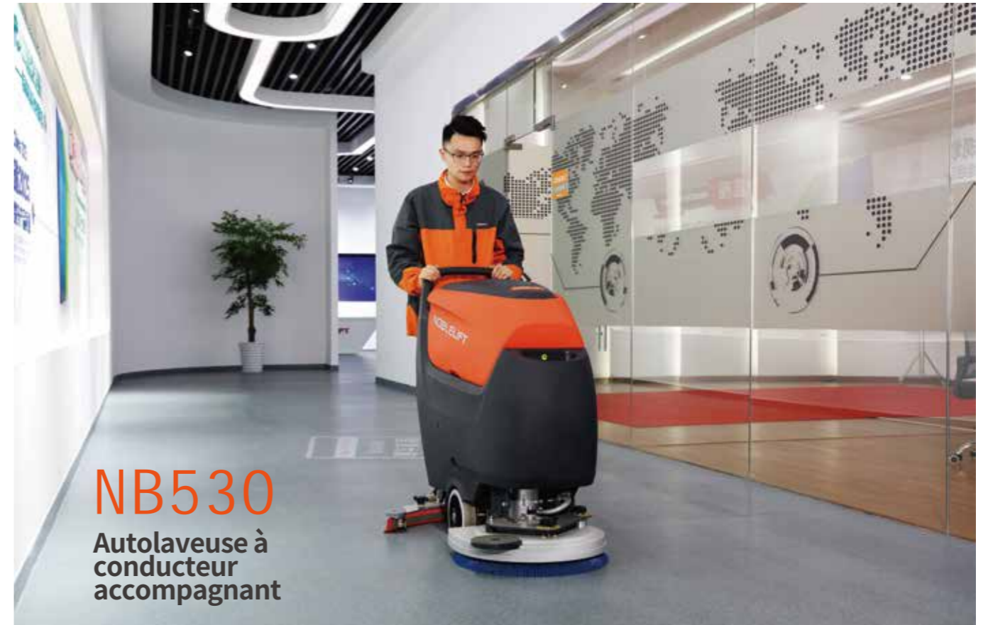
NB530 Autolaveuse à conducteur accompagnant

Les bandes en polyuréthane (PU) présentent une forte résistance à l'usure et à l'huile, ce qui les rend adaptées aux sols huileux, mais leur capacité de coupe et d'arrachement est médiocre, de sorte qu'elles ne conviennent pas aux sols en quadrilatère, en brique ou en carrelage.